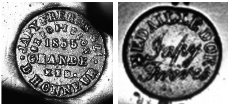
Ил. 4, 5. Клейма на механизмах часов компании «Братья Жапи»

ху – белый орёл под короной с раскинутыми крыльями. Корпус украшен фигурами нимфы, римского воина, играющих путти, увенчан резным куполом с нимфой в розовой тунике с трубой. Декоративные элементы лепнины и росписи выполнены вручную. На механизме часов проставлено круглое клеймо с круговой надписью «MEDAILLE D`OR» и «Jary Freres» в центре, которое говорит о том, что часы произведены в первой трети XIX в. компанией «Братья Жапи» (ил. 4).