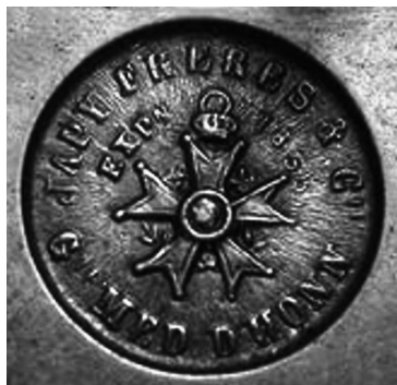
Ил. 3. Клеймо на механизме часов компании «Братья Жаши»

художественного музея Республики Беларусь, фарфоровый корпус часов сделан на Мейсенской мануфактуре в первой трети XIX в. На дно нанесена подглазурная синяя марка в виде перекрещенных мечей, которая подтверждает атрибуцию и клейма в массе в виде арабских цифр «452» и «76». Вероятнее всего изначально был изготовлен роскошный футляр, щедро декорированный орнаментом, а позже, в соответствии с размерами готового корпуса, был заказан часовой механизм 1 . Модель корпуса под названием «Польша» была разработана в 1743 г. Иоганном Иоахимом Кендлером для короля польского и великого князя литовского Августа III 2 . Последующие копии отличаются от оригинала мелкими деталями в пластических декорациях. Циферблат часов круглый, в бронзовом обрамлении, с римскими цифрами и двумя стрелками. На корпусе в стилизованном картуше изображён герб Речи Посполитой: четырёхчастный щит, в двух частях которого польский белый орёл, в остальных – «Погоня» Великого Княжества Литовского. Корона как символ королевской власти отсутствует. Вокруг циферблата – пышные гирлянды из цветов и листьев. Свер-