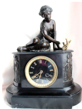
Часы кабинетные «Братья Жати», 2-я половина XIX в.