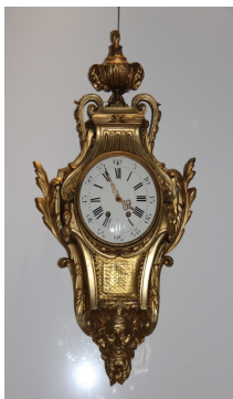
Часы-картель «Винченци и компания», 1855–1870 гг.