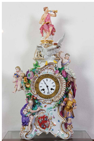
Часы каминные «Братья Жапи», 1-я треть XIX в.