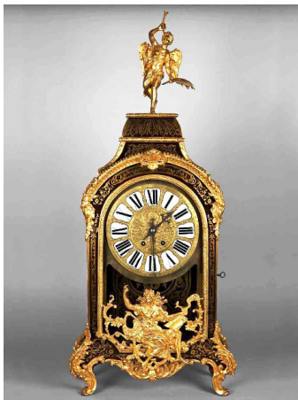
Часы каминные в стиле Буль «Винченци и компания», 1880-е гг.