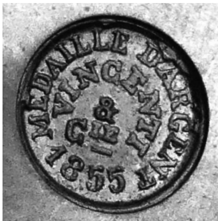
Ил. 1. Клеймо на механизме часов-картеля предприятия «Винценти и компания».

Предприятием «Винценти и компания» произведены часы-картель (настенные часы), которые были переданы музею-заповеднику «Несвиж» Брестской таможней в 2013 г. (см. вклейку ). При атрибуции предмета на механизме выявлено клеймо – изображение медали с надписями: «MEDAILLE D'argent 1855» / «VINCENTI» ( ил. 1 ). На основании этого можно утверждать, что часы были изготовлены в 1855–1870 гг. Художественное решение корпуса выполнено в стиле декоративно-прикладного искусства эпохи рококо: рокайльные завитки, стилизованные растительные мотивы, ваза, которой увенчан корпус, улыбающийся маскарон 1 . Глянцевое огневое золочение корпуса придает предмету особенно эффектный вид. Часы можно увидеть в постоянной экспозиции «Кабинет князя» сектора «Дворцовый ансамбль».