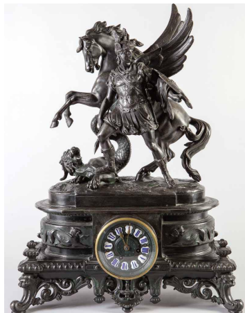
Часы каминные «Братья Жапи», 2-я половина XIX в.