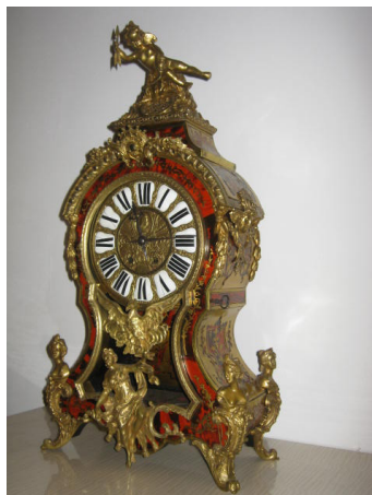
Часы каминные в стиле Буль «Винченци и компания», 1855–1870 гг.