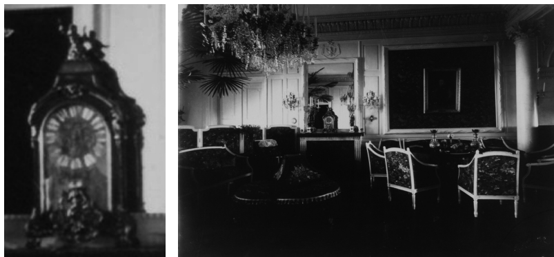
Ил. 2. Часы в интерьере бального зала Несвижского дворца. Фото Юзефа Боретти, 1894 г.

из орехового дерева, покрыт чёрным лаком и декорирован латунью. Порттик увенчан фигуркой бегущего бронзового ангела с трубой в руке. Внизу корпуса фигура сидящей бронзовой нимфы с книгой в руках и большой птицей.